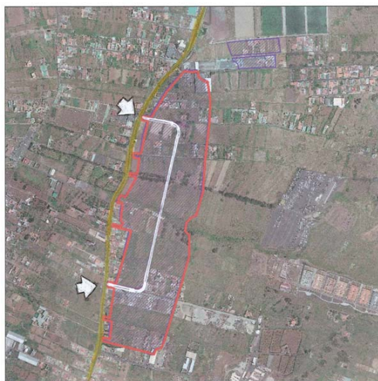
Ortofotografía Polígonos comarcales potenciales Áreas industriales inventariadas