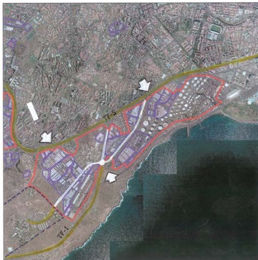
Ortofotografía [Red line] Polígonos comerciales potenciales [Blue line] Usos dotacionales [Grey hatched] Áreas industriales inventariadas