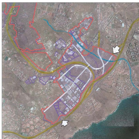
Ortofotografía Polígonos comarcales potenciales Áreas industriales inventariadas