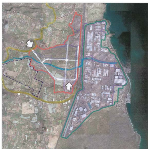
Ortofotografía Políg. insulares Políg. comerciales potenciales Usos agrícolas Áreas industriales inventariadas