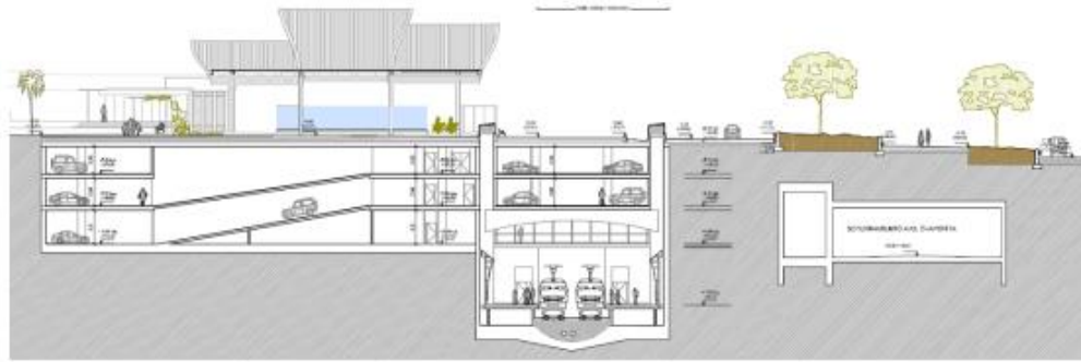
Figura 2. Sección transversal del intercambiador

El proyecto de intercambiador de Los Cristianos contempla su ubicación al norte de la Avenida Chayofita. Con esa configuración la avenida supone una barrera física que dificulta el acceso de peatones y vehículos al intercambiador. Por ello se ha planteado el soterramiento de la Avenida Chayofita.