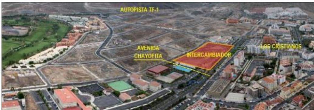
Figura 1. Localización del futuro intercambiador

La ejecución del intercambiador comporta la ejecución de un edificio de cuatro niveles bajo rasante y un nivel sobre rasante en la Avenida Chayofita de Los Cristianos. La superficie ocupada es de 47.504,38 m 2 , aunque la superficie afectada es mayor (60.474,38 m 2 ). La superficie construida se estima en 37.414,19 m 2 .