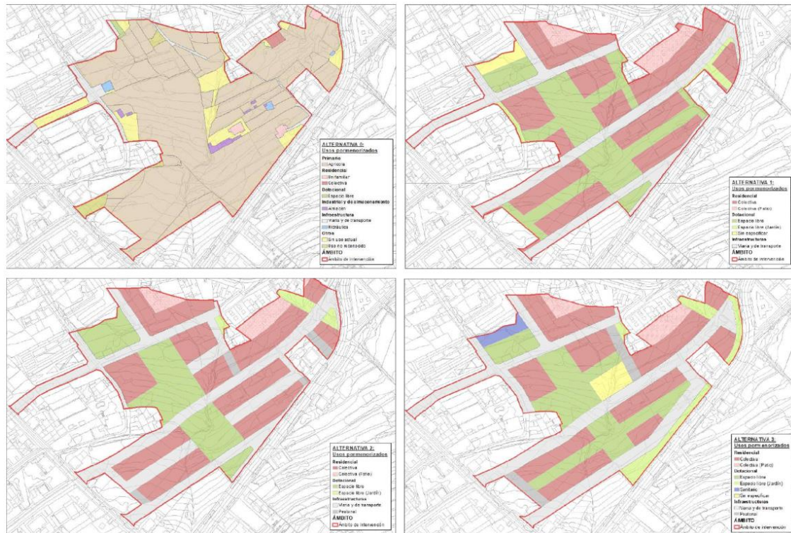
Figura 3. Alternativas de ordenación pormenorizada. Alternativa 0 (superior izquierda), Alternativa 1 (superior derecha), Alternativa 2 (inferior izquierda) y Alternativa 3 (inferior derecha).

Tomando como elemento de partida la redelimitación descrita, la modificación menor analizada contempla cuatro alternativas de ordenación para el ámbito, entre las que se incluye la alternativa cero.