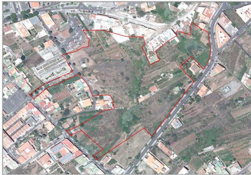
Figura 1. Ámbito territorial de la Modificación Menor.

La figura 1 muestra la delimitación del ámbito territorial analizado.