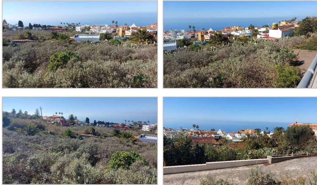
Figura 2. Estado actual del ámbito objeto de la Modificación Menor del PGO (16/03/2024)

El estado actual que presenta la pieza territorial objeto de esta nueva propuesta de ordenación se muestra en las imágenes de la figura 2.