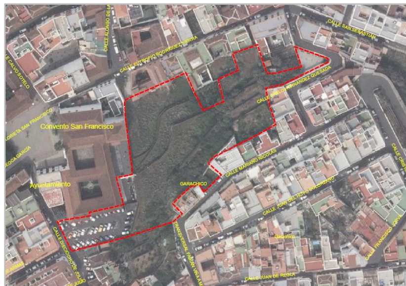
Figura 1. Ámbito territorial de la Modificación Menor

La figura 1 muestra la delimitación del ámbito territorial analizado.