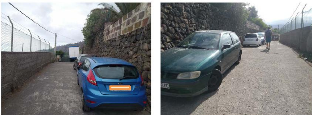
Figura 22. Estacionamientos sin regulación

Por su parte, en cuanto a la capacidad de acogida ecológica, las visitas están limitadas por el riesgo de afección a los ecosistemas debido a la precariedad y peligrosidad de los accesos., mientras que la capacidad de acogida psicológica no se ha aplicado al considerarse los resultados no significativos por cierre al uso público, la precariedad del acceso y la escasez de aparcamientos, puesto que se usan como tales los márgenes de las vías rodadas del entorno.