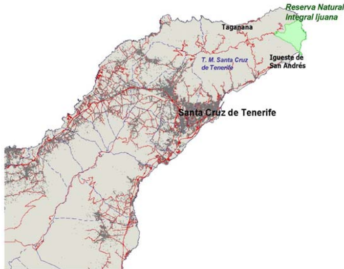
FIGURA 0 Localización de la Reserva Natural Integral de Ijuana en la isla