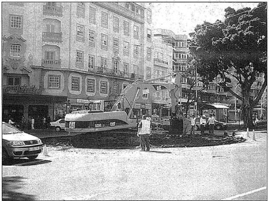
Un operario supervisa las obras que se ejecutaban en la mañana de ayer.

Un cuerpo de operarios del Ayuntamiento trabajaba en la mañana de ayer en las tareas de vaciado de la plaza con el fin de ceder el paso a la nueva línea férrea. Los trabajos que se ejecutaron a lo largo de la mañana no pasaron desapercibidos para multitud de viandantes que se apresuraron a echar la última mirada o sacar fotos de un lugar mágico en el que seguramente quedaron con alguna persona especial, donde también pudo haber un primer beso, o donde los aficionados del CD Tenerife celebraban sus victorias más sonadas. La magia de un lugar que, en definitiva, ya ha entrado a formar parte del pasado. La Plaza de la Paz se ha visto obligada a abandonar su lugar natural en beneficio del desarrollo y las necesidades de la isla, en concreto por la obra del tramvia, uno de los proyectos más ambiciosos en presupuesto y en tiempo de los últimos años.