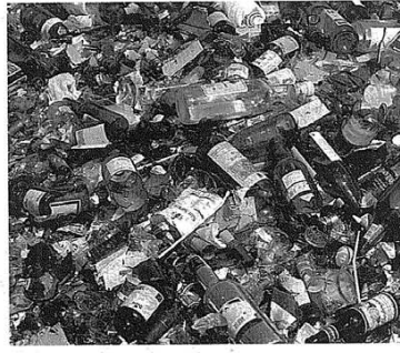
El llamamiento está dirigido a los ayuntamientos de la Isla y a las empresas gestoras para no parar el ritmo de reciclado alcanzado. EL DÍA

La Consejería de Medio Ambiente del Cabildo de Tenerife demandó ayer a los ayuntamientos y empresas gestoras de residuos la "máxima" implicación en el reciclado de vidrio. La petición la ha hecho para lograr que no decrezca el ritmo de trabajo de la planta de reciclado de ese producto radiada en el Complejo Medioambiental de Arico. En un comunicado se indica que, en menos de un año, que es el tiempo que lleva la citada instalación en funcionamiento, el centro