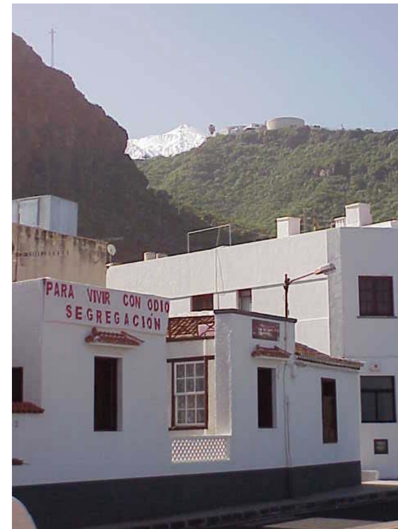
San Juan de La Rambla (desde el casco)

Este paisaje cuenta con una característica única. Se trata de la visión que desde cada uno de los municipios se tiene del Teide. A continuación se muestran distintas perspectivas tomadas desde el viario siguiendo el recorrido desde San Juan de la Rambla hasta Buenavista del Norte, terminando en El Tanque.