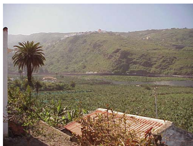
2.- T-33: Paisaje Protegido Acantilados de La Culata