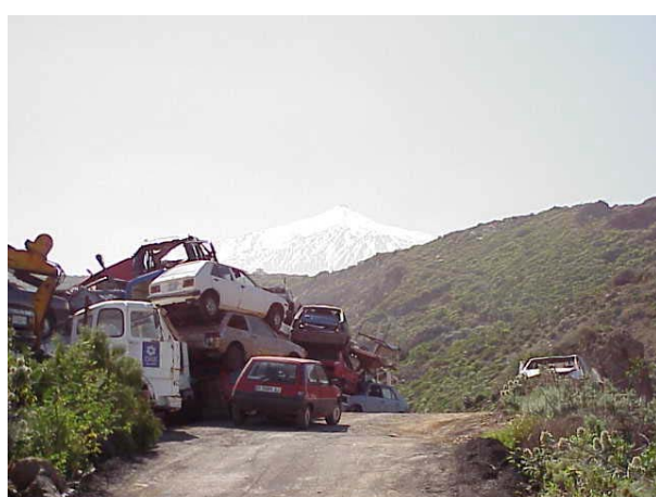
Icod de Los Vinos (Desde El Riquel)