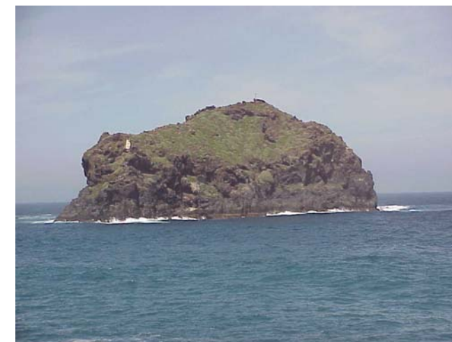
3.- T-26: Monumento Natural Roque de Garachico