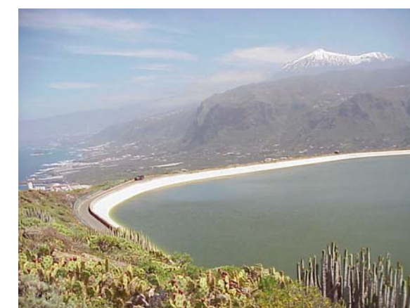
Buenavista del Norte (desde Montaña de Taco)