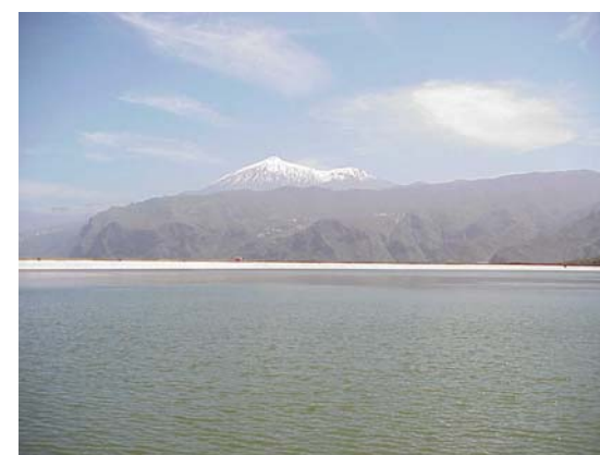
Buenavista del Norte