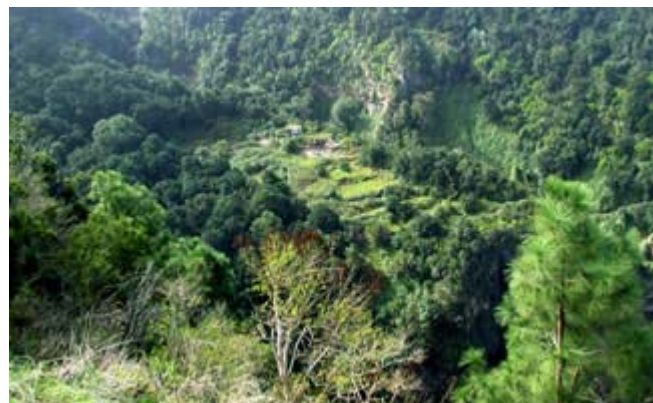
1.- T-42: Sitio de Interes Cientifico Barranco de Ruiz