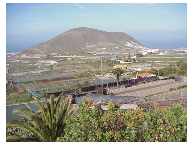
4.- Montaña de Taco