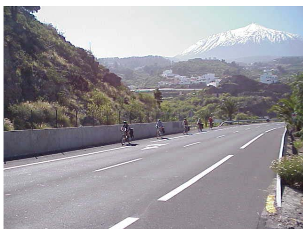
Icod de Los Vinos